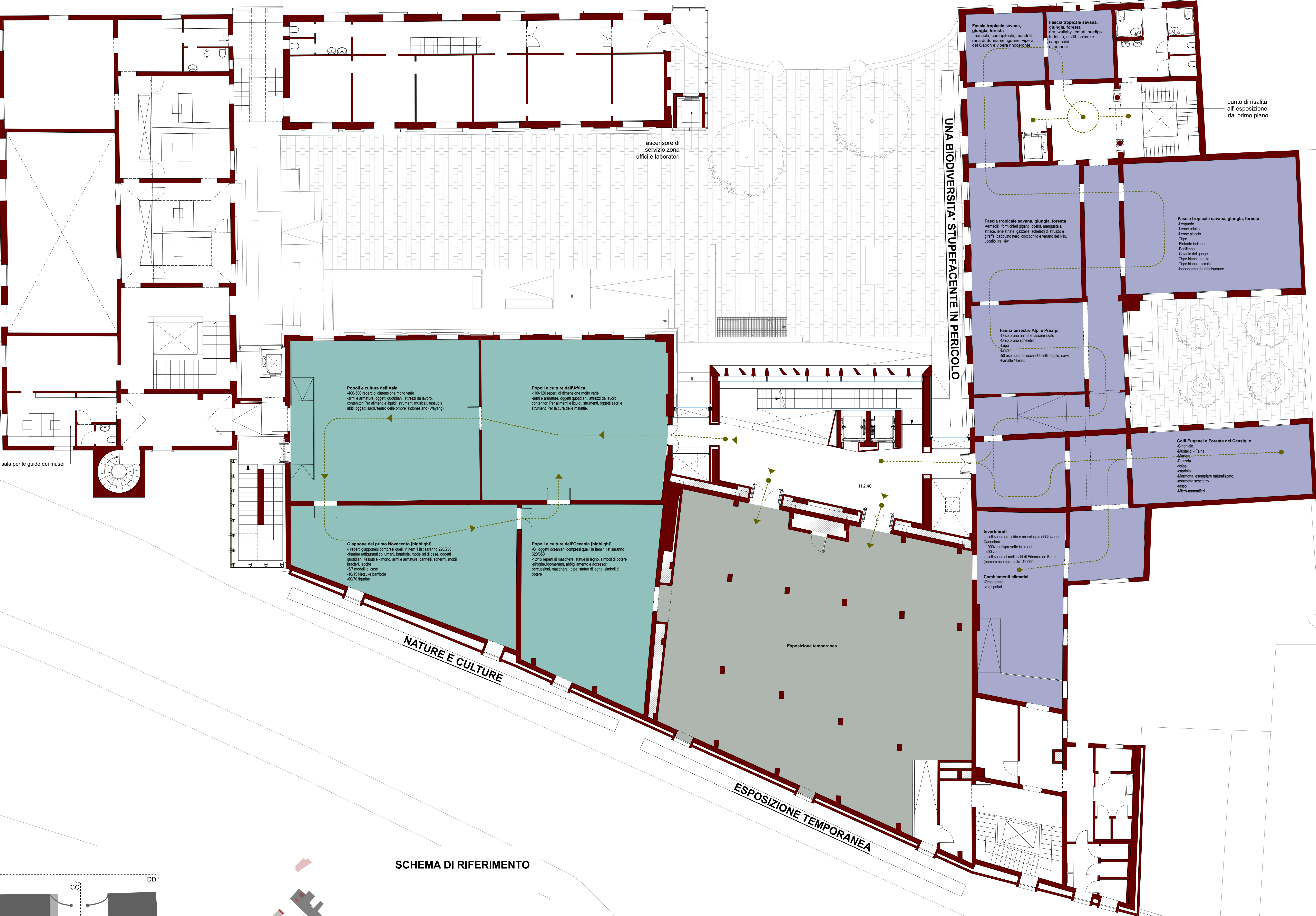
SCHEMA DI RIFERIMENTO

La disposizione degli argomenti e dei singoli reperti all'interno delle specifiche stanze è da intendersi indicativo e soggetto a variazioni in fase di progetto di allestimento museografico.