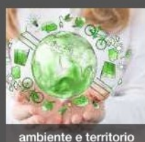
ambiente e territorio