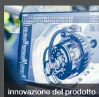
innovazione del prodotto