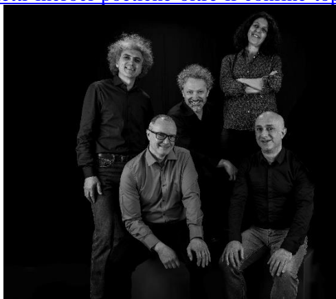
TOP – Teatri Off Padova

https://www.eventbrite.it/e/biglietti-incroci-poetiche-oltre-il-confine-top-618917728587