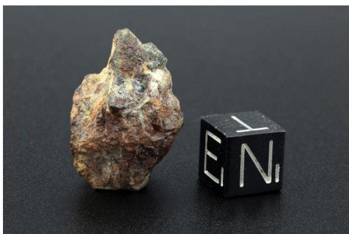
Meteorite da Tessera

Tra gli esemplari presenti in mostra - che provengono dalla collezione di Matteo Chinellato, una delle più importanti in Italia, e dal Centro Interdipartimentale di Studi e Attività Spaziali