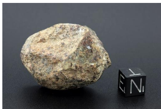
Meteorite da Lido di Venezia