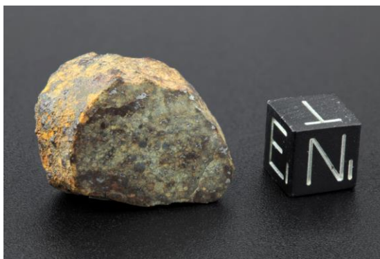
Meteorite da Piave