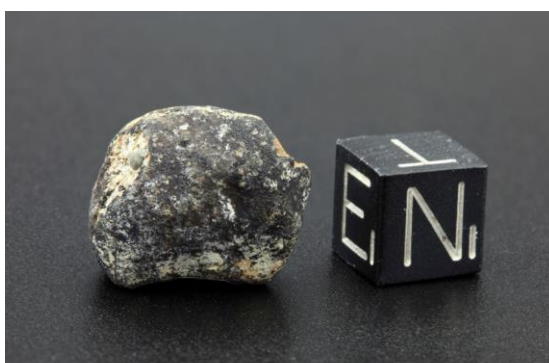
Meteorite da Tessera