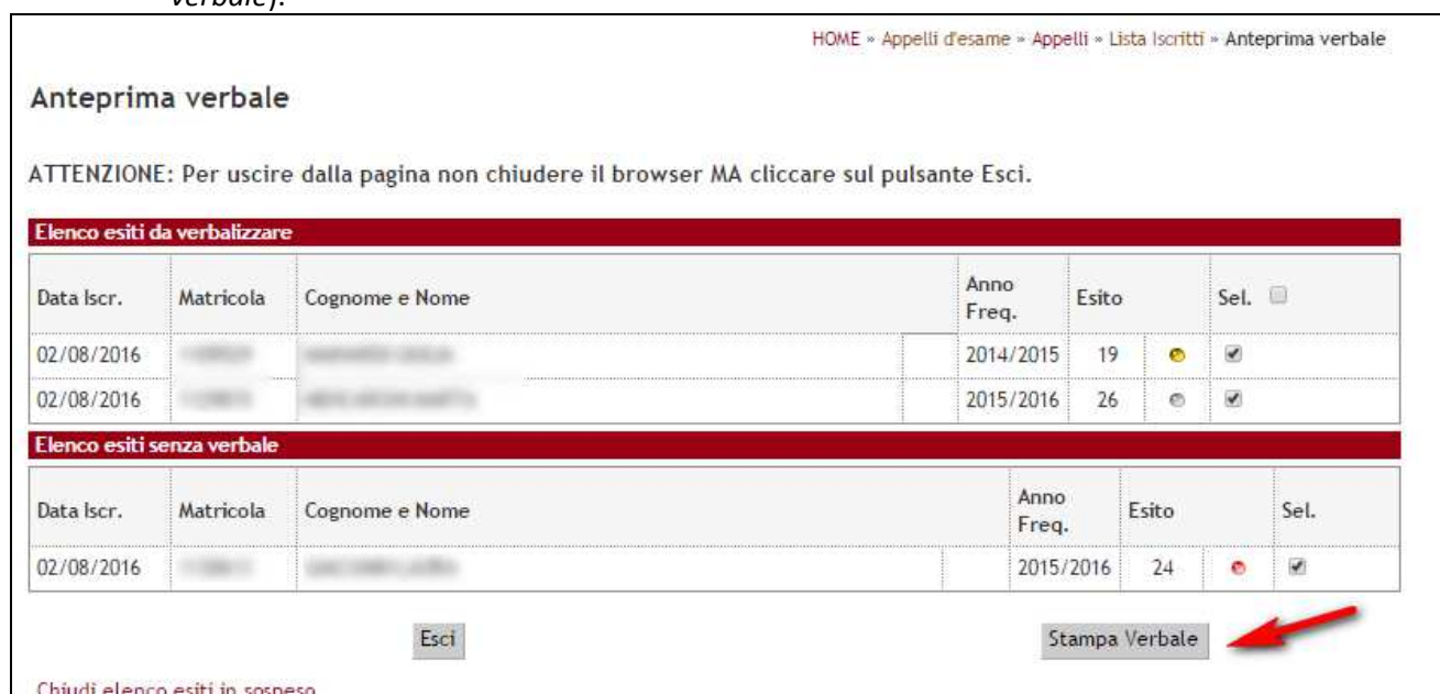
Figura 6: Verbalizzazione finale successiva ai 7 giorni

Con questa nuova modalità al superamento dei 7 giorni sarà possibile effettuare un unico lotto contenente tutti gli studenti e chiudere l'appello.