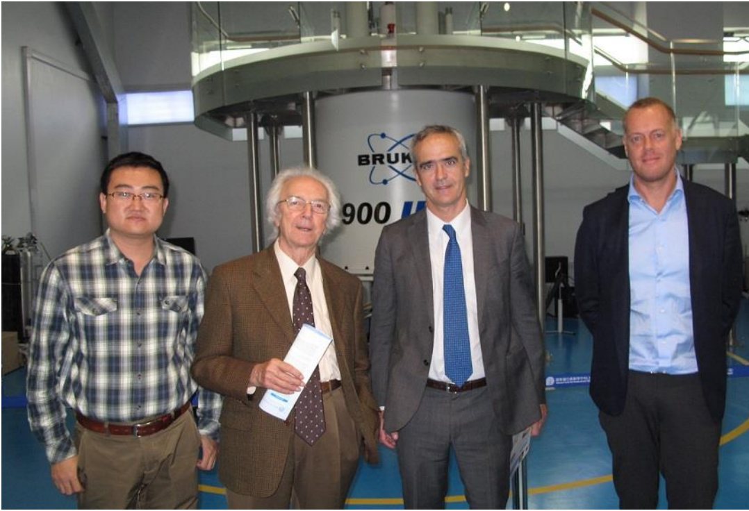
Shanghai Tech Lab visit