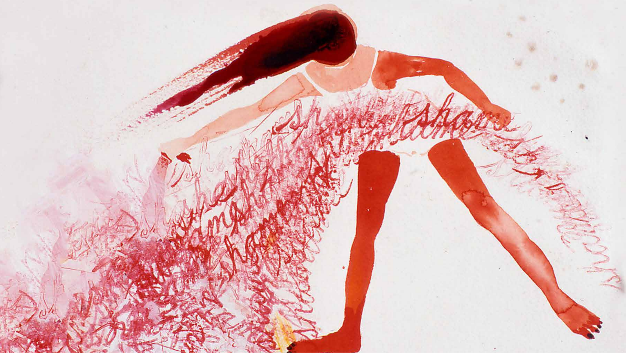
Immagine © Penny Siopis, Shame series (2005)

Gruppo di lavoro sul linguaggio di genere , Università di Padova